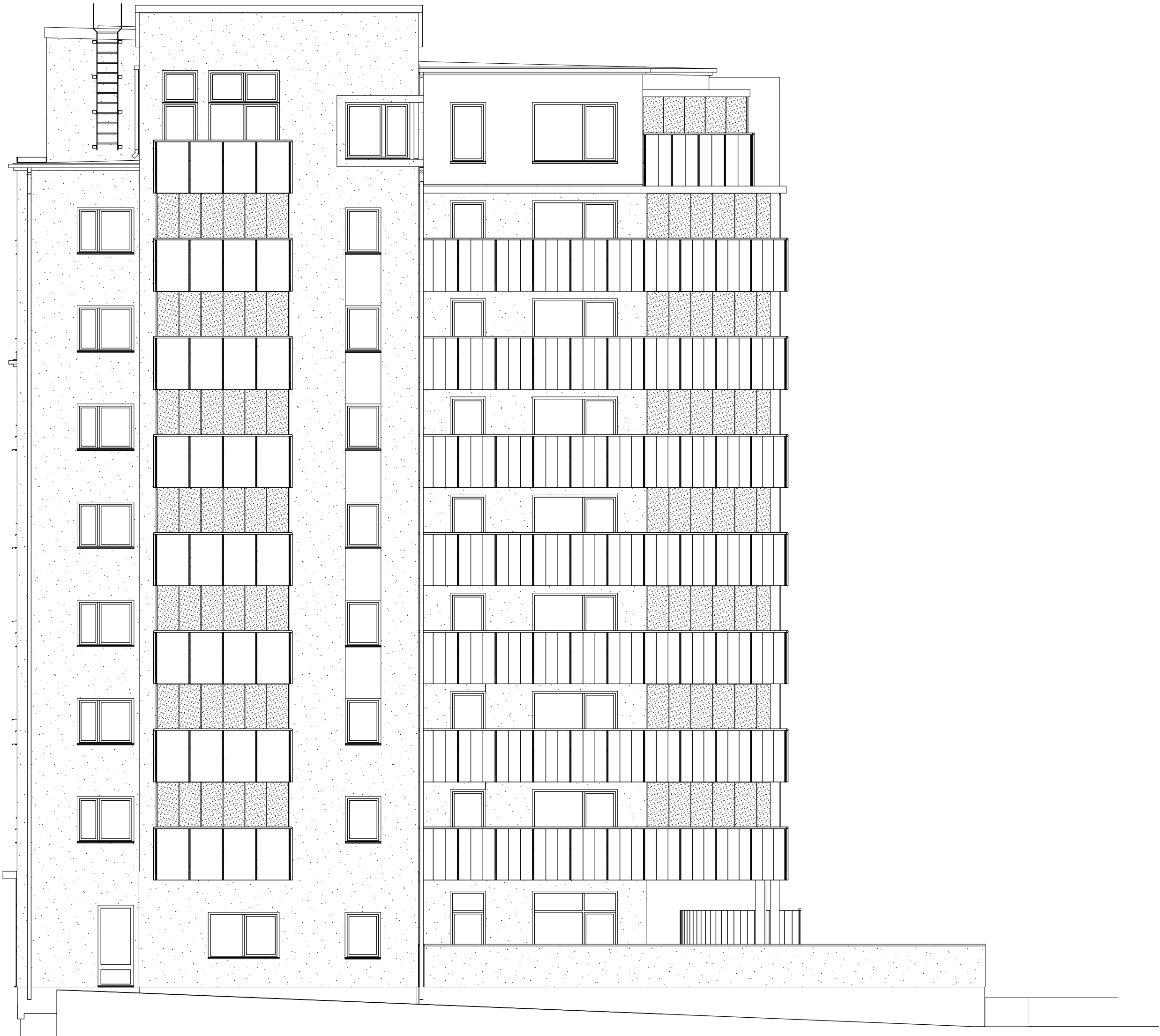
Fasad med väderskydd mot gångstråk i norr, Hus 2