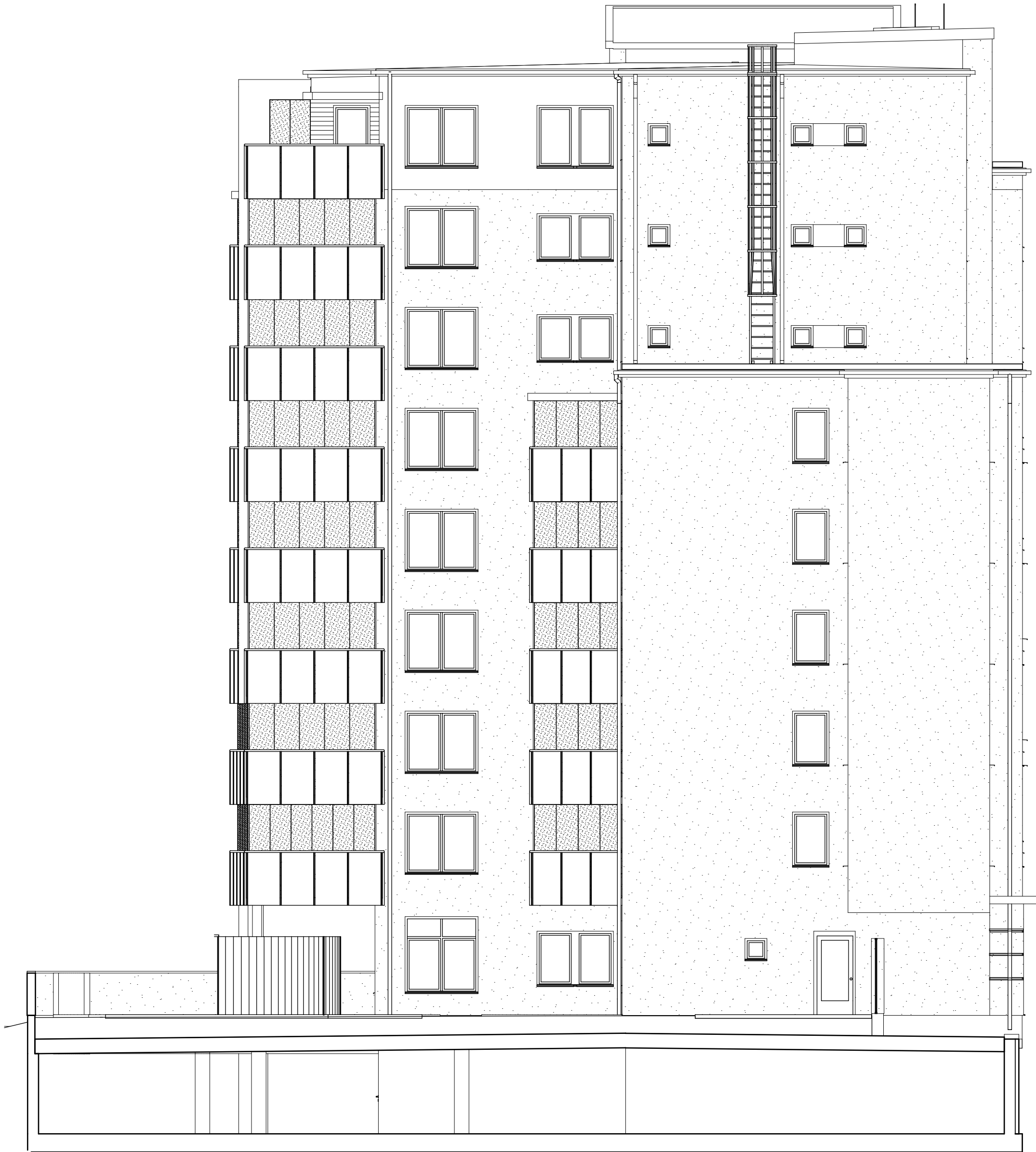
Fasad med väderskydd mot gården i söder, Hus 2

Inglasning med vikbart inglasningssystem. Övre och undre profil i NCS S 7502-B av härdat klarglas, profilfösa sidor. Luckorna monteras innanför räcket, viks ihop och samlas mot vägg enl. plan. Systemet är våningshögt.